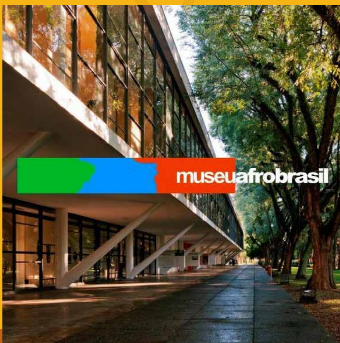
Museu Afro Brasil

http://www.museuafrobrasil.org.br/apoie/programa-de-s%C3%B3cios