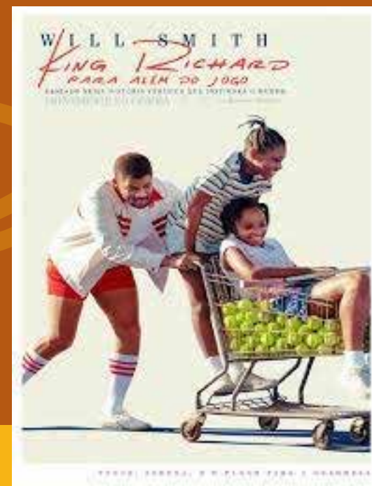
Filme - King Richard Disponível na HBO max